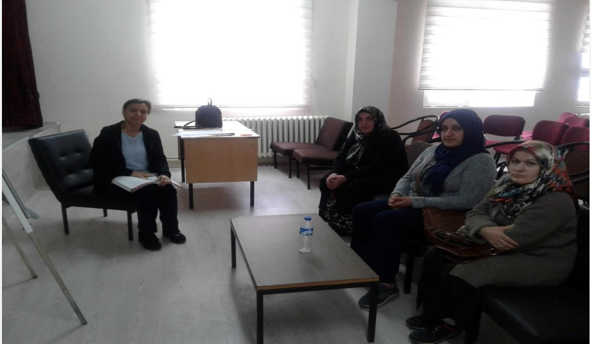
Görsel-1.1 ( Gönüllü örneklem grup eğitimleri)

Proje öncesi yaptığımız çalışmaların görselleri: