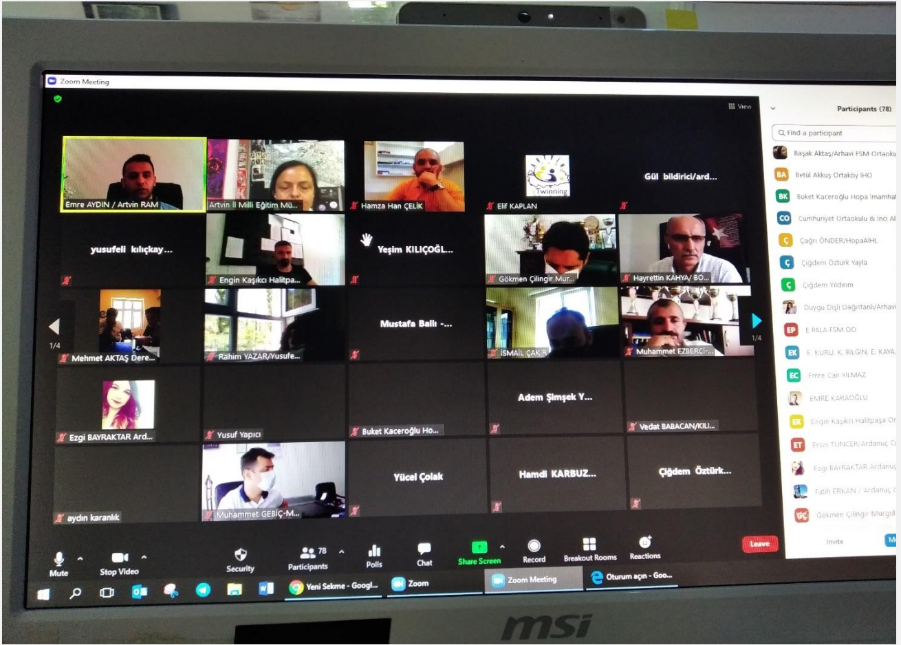
Görsel-7 (Paydaş toplantıları)