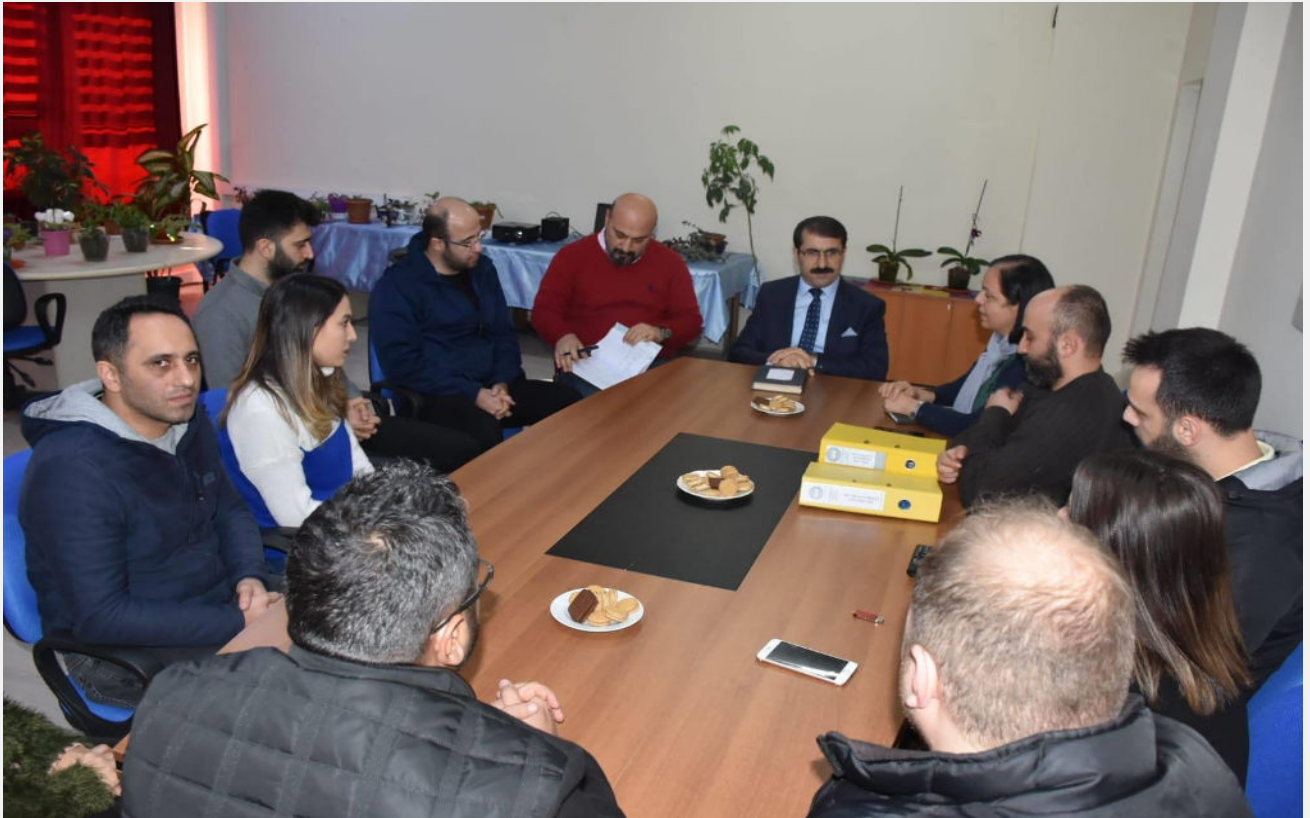
Görsel-8 (Üs Kurum Amirlerinin proje hakkında bilgilendirilmesi)