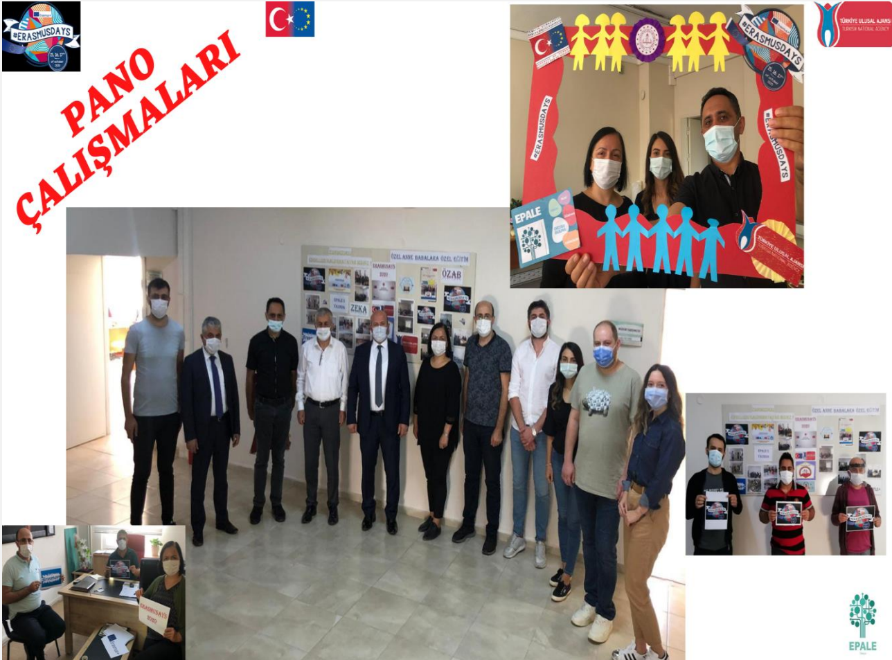
Görsel-9.2 (Kurum içi tanıtım)