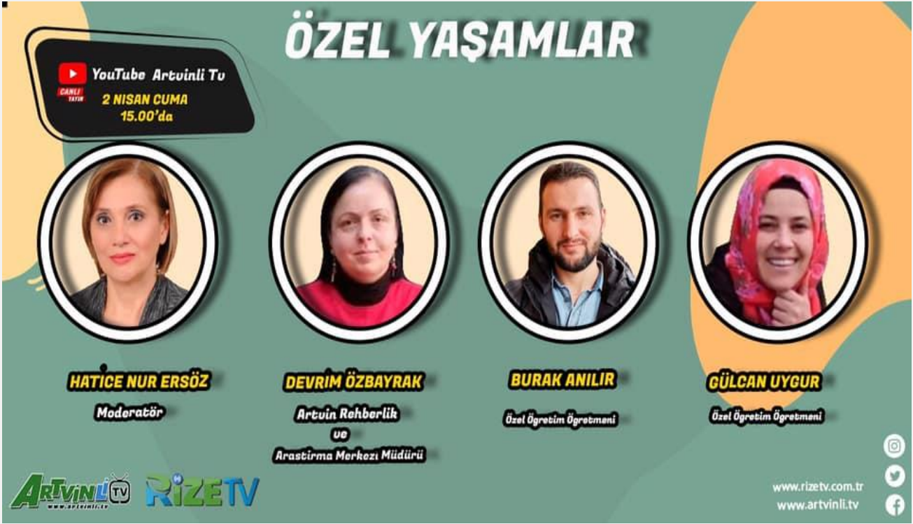
Görsel-9.1 (Yerel basın demeci)