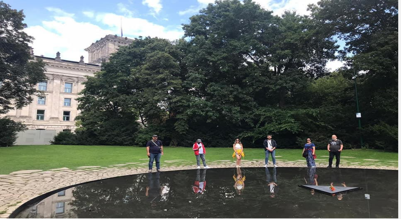
Görsel-11.14 (Oryantasyon, Kültürel etkinlikler)