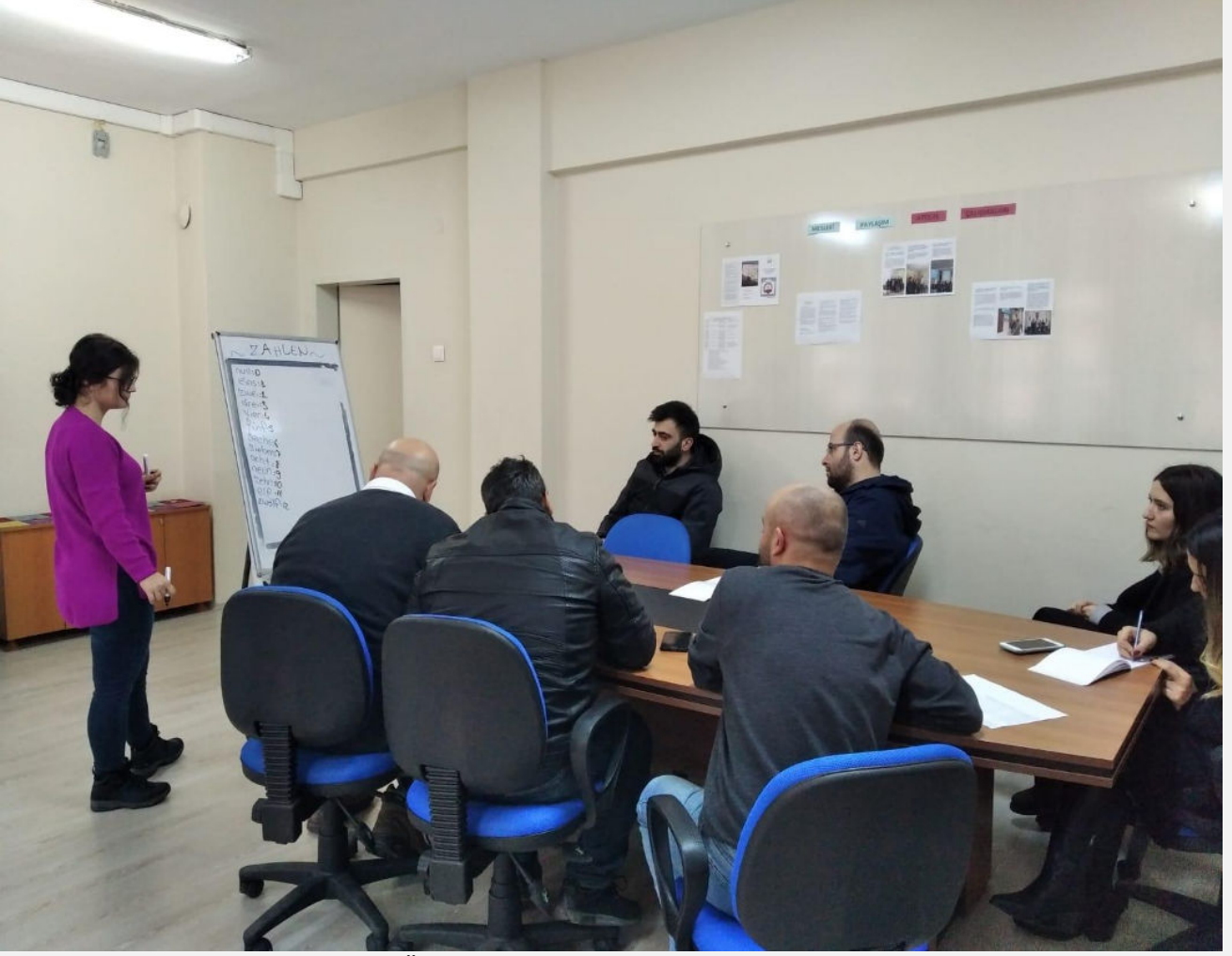
Görsel-6.1 ( Katılımcıların Proje Öncesi Hazırlık Çalışmaları- Dil Kursu )