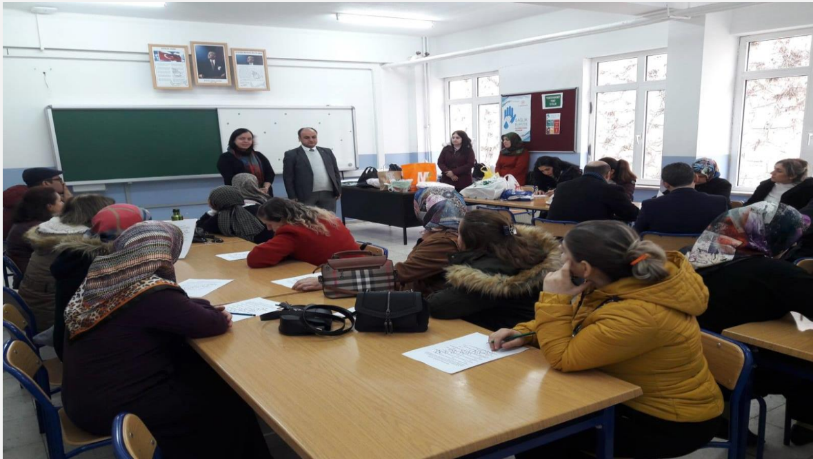
Görsel-2 ( Normal ve Özel Anne Baba Eğitim Çalışmaları)