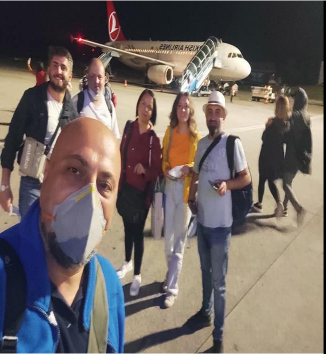
Görsel-6.2 ( Katılımcıların Proje Öncesi Hazırlık Çalışmaları )