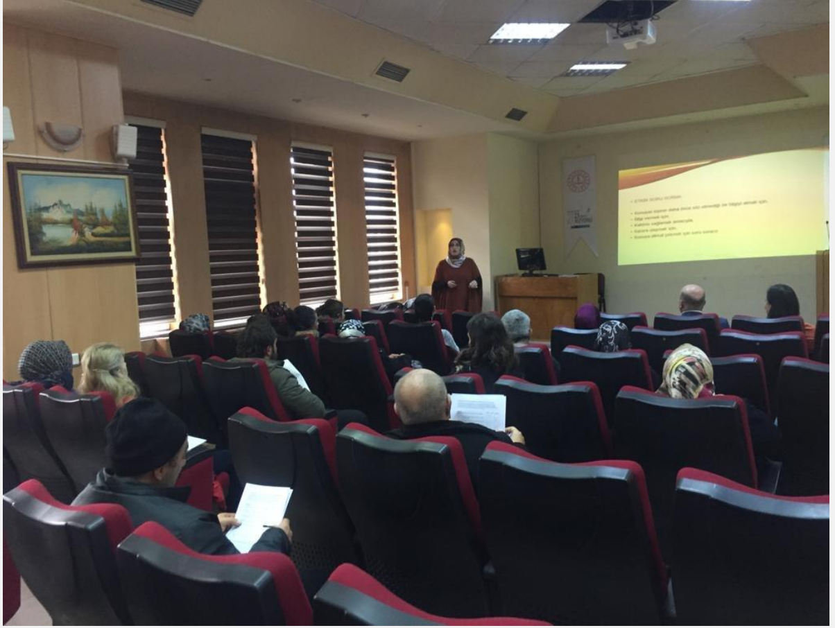
Görsel-3.1 ( Kurumlar arası işbirliği ile yapılan yüz yüze anne baba eğitimleri)