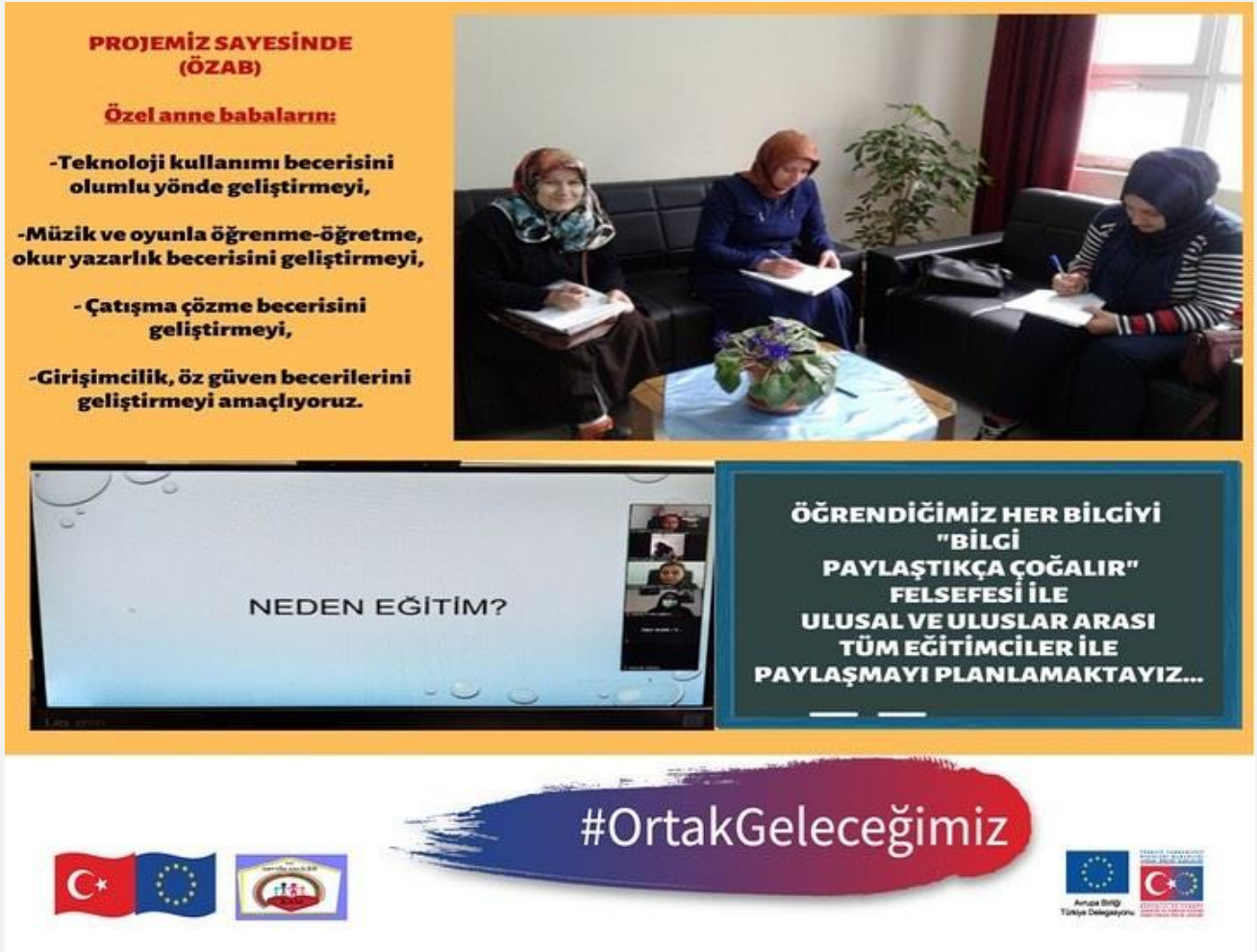
Görsel-10.1 (Ulusal ve uluslararası Online tanıtım çalışmaları)