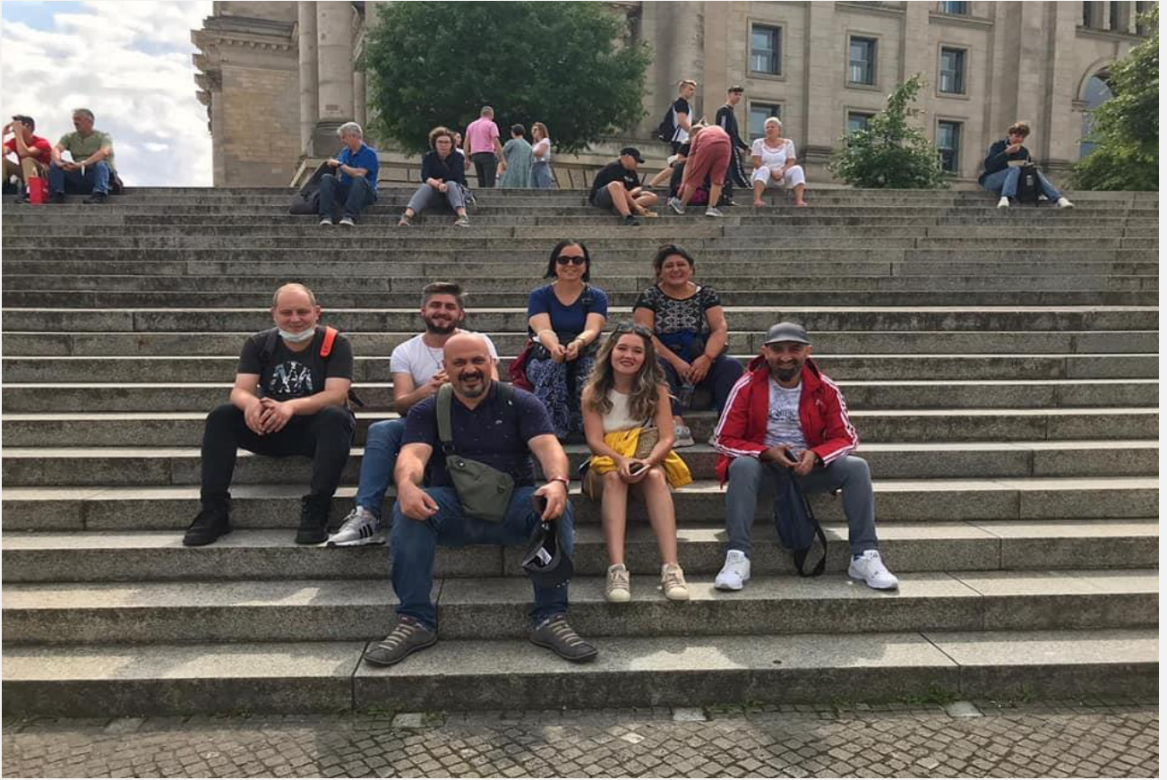
Görsel-11.13 (Oryantasyon, Kültürel etkinlikler)