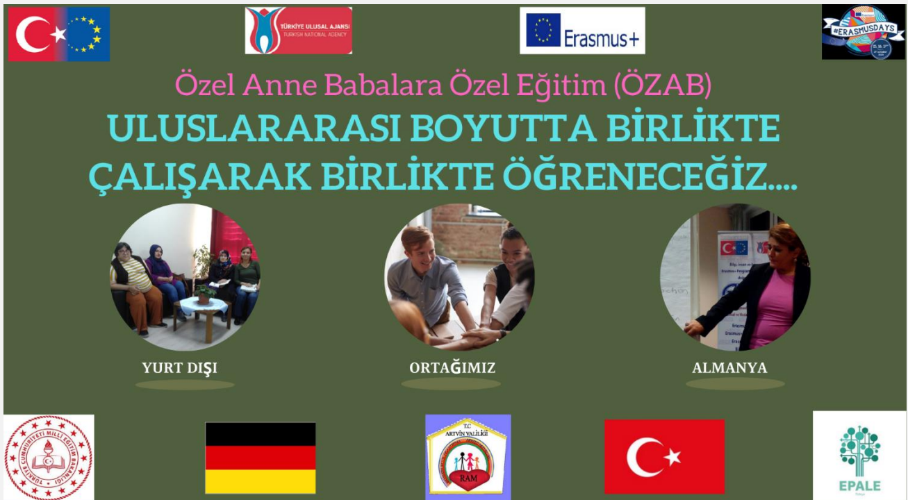
Görsel-10.2 (Ulusal ve uluslararası Online tanıtım çalışmaları)