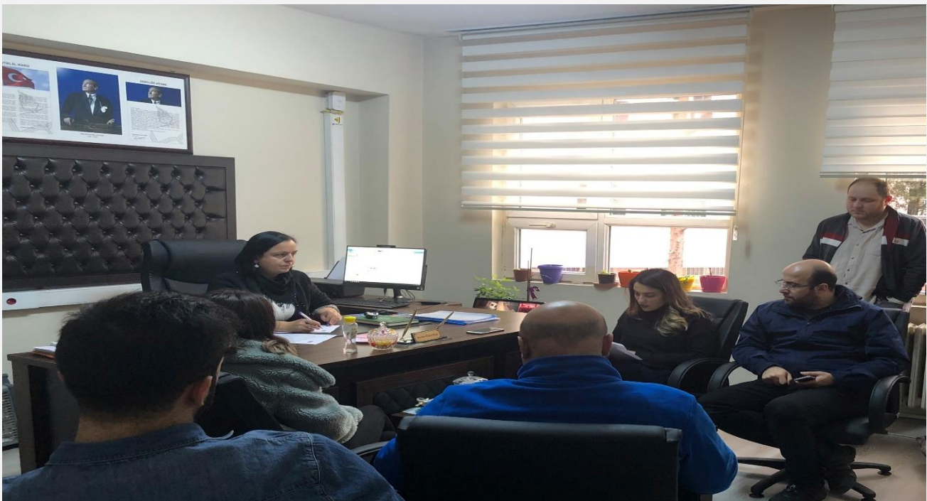
Görsel-5 (Kurum İçi personel toplantısı )