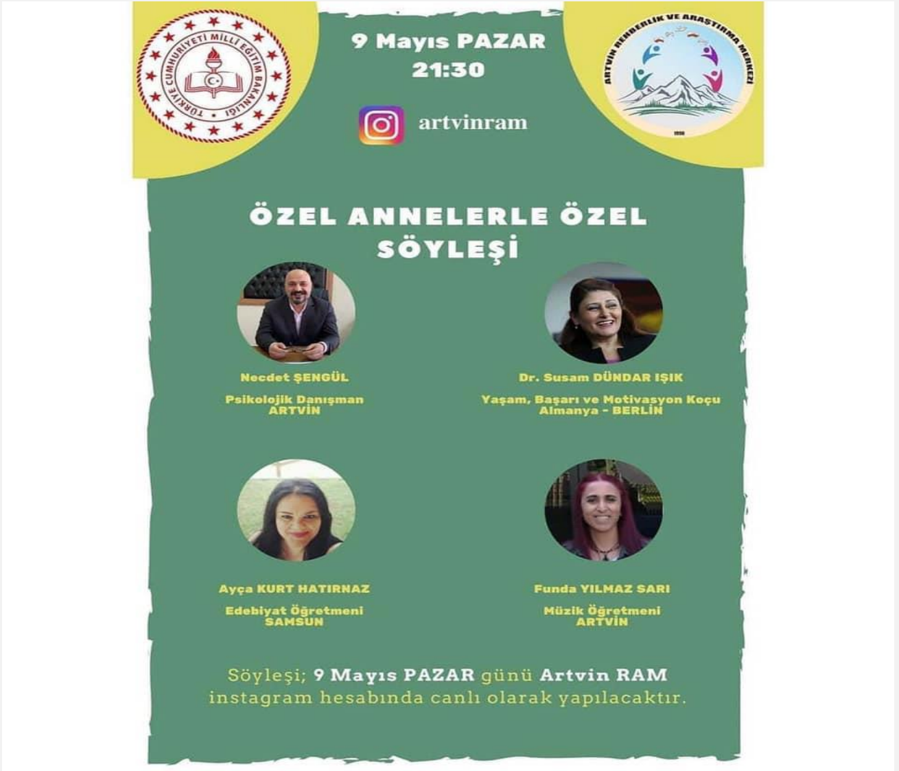
Görsel-9.3 (Kurum içi tanıtım)