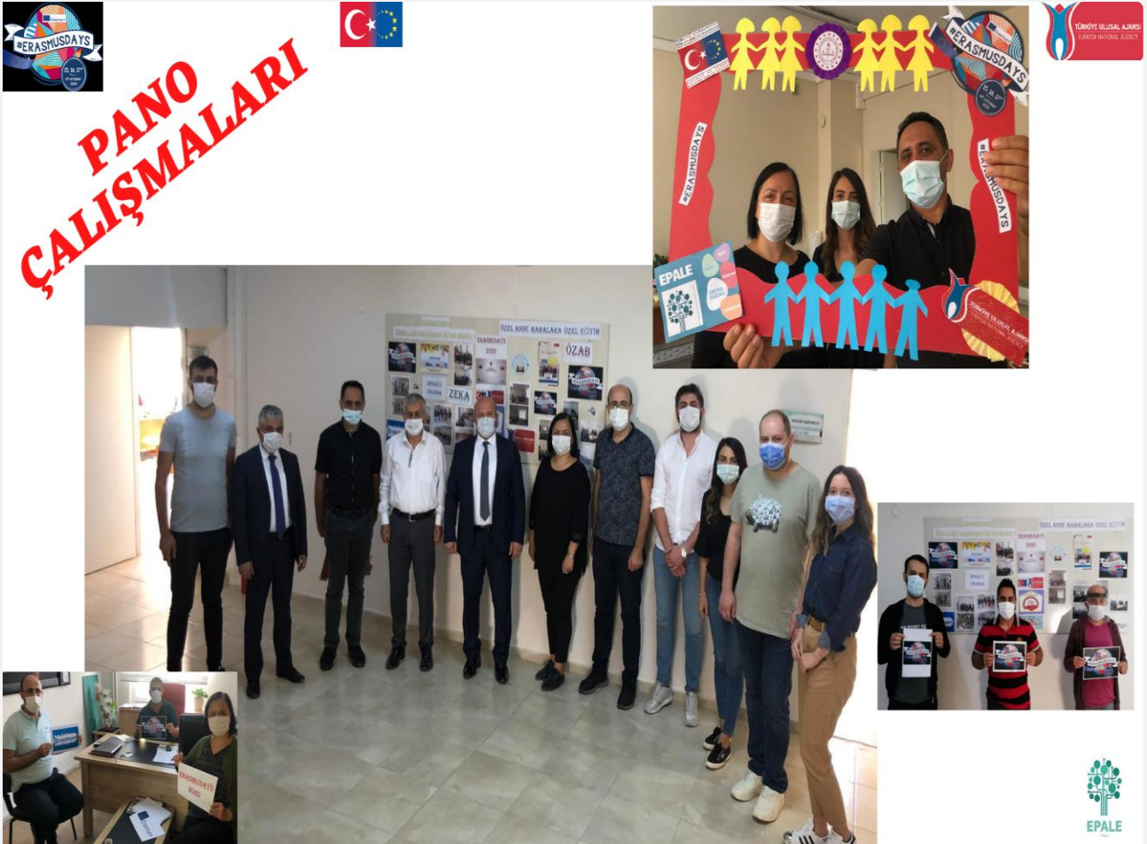
Görsel-9.2 (Kurum içi tanıtım)