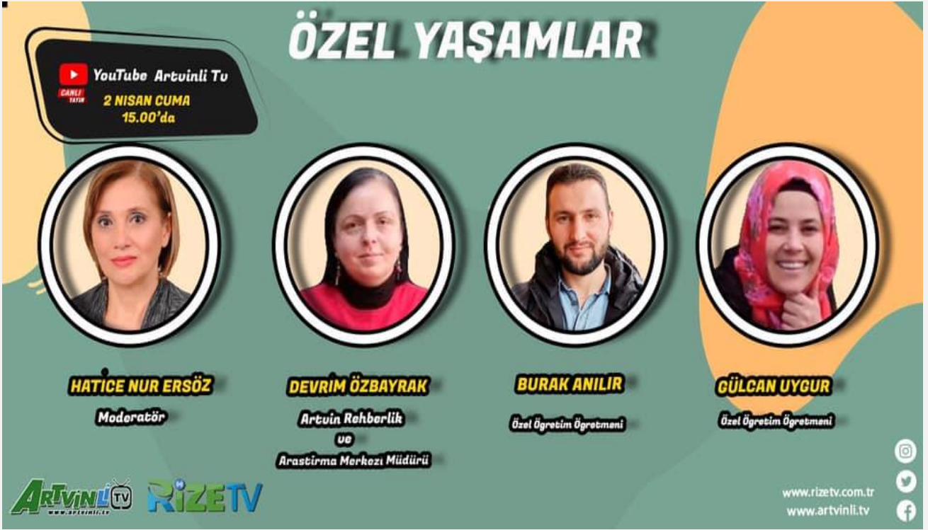
Görsel-9.1 (Yerel basın demeci)